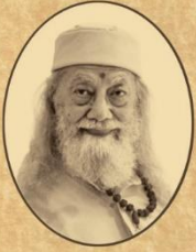
PARAMAHAMSA HARIHARANANDA (1907-2002)

Erfüllt von Reinheit und Liebe, kam er von einer ununterbrochenen Meisterlinie. Paramahansa Hariharananda erreichte Nirvikalpa Samadhi, den Zustand ohne Puls und Atem und der höchsten Glückseligkeit. Er war ein direkter Schüler von Swami Shriyukteshwarji und Paramahansa Yoganandaji. Dieser verwirklichte Yogi verbreitete die Lehre des Kriya Yoga in Indien und der ganzen Welt.