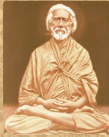
SWAMI SHRIYUKTESHWAR GIRI