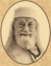
PARAMAHAMSA HARIHARANANDA (1907-2002)

Erfüllt von Reinheit und Liebe, kam er von einer ununterbrochenen Meisterlinie. Paramahansa Hariharananda erreichte Nirvikalpa Samadhi, den Zustand ohne Puls und Atem und der höchsten Glückseligkeit. Er war ein direkter Schüler von Swami Shriyukteshwarji und Paramahansa Yoganandaji. Dieser verwirklichte Yogi verbreitete die Lehre des Kriya Yoga in Indien und der ganzen Welt.