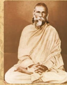
SWAMI SATYANANDA GIRI