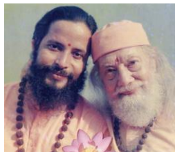
HARIHARANANDA (1907-2002) - (im Foto rechts)

Kriya Yoga ist eine uralte Meditations- und Lebenswissenschaft, die Körper, Geist, Intellekt und Seelenbewusstheit kultiviert, indem sie kraftvolle yogische und meditative Übungen einsetzt. Sie hilft uns durch Konzentrationstechniken, Körperstellungen und Atmung die drei göttlichen Qualitäten Licht, Vibration und Ton wahrzunehmen. Dadurch wird ein Geist entwickelt, der auf einen einzigen Punkt konzentriert ist und uns befähigt zu den tiefsten Bewusstseinssebenen vorzudringen und unser Leben zu verändern. Kriya Yoga lehrt, dass jede Aktion, kri , durch ya , die innewohnende Seele ausgeführt wird. Es ist eine universelle spirituelle Disziplin, die alle Trennungen und Grenzen überwindet.