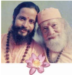
HARIHARANANDA (1907-2002) - (im Foto rechts)

Kriya Yoga ist eine uralte Meditations- und Lebenswissenschaft, die Körper, Geist, Intellekt und Seelenbewusstsein kultiviert, indem sie kraftvolle yogische und meditative Übungen einsetzt. Sie hilft uns durch Konzentrationstechniken, Körperstellungen und Atmung die drei göttlichen Qualitäten Licht, Vibration und Ton wahrzunehmen. Dadurch wird ein Geist entwickelt, der auf einen einzigen Punkt konzentriert ist und uns befähigt zu den tiefsten Bewusstseinssebenen vorzudringen und unser Leben zu verändern. Kriya Yoga lehrt, dass jede Aktion, kri , durch ya , die innewohnende Seele ausgeführt wird. Es ist eine universelle spirituelle Disziplin, die alle Trennungen und Grenzen überwindet.