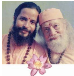
HARIHARANANDA (1907-2002) - (im Foto rechts)

Kriya Yoga ist eine uralte Meditations- und Lebenswissenschaft, die Körper, Geist, Intellekt und Seelenbewusstsein kultiviert, indem sie kraftvolle yogische und meditative Übungen einsetzt. Sie hilft uns durch Konzentrationstechniken, Körperstellungen und Atmung die drei göttlichen Qualitäten Licht, Vibration und Ton wahrzunehmen. Dadurch wird ein Geist entwickelt, der auf einen einzigen Punkt konzentriert ist und uns befähigt zu den tiefsten Bewusstseinssebenen vorzudringen und unser Leben zu verändern. Kriya Yoga lehrt, dass jede Aktion, kri , durch ya , die innewohnende Seele ausgeführt wird. Es ist eine universelle spirituelle Disziplin, die alle Trennungen und Grenzen überwindet.